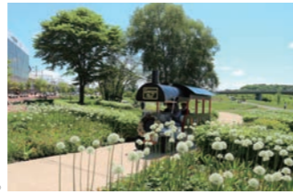
ガーデン号の運行は6～9月の週末を予定。

旭川駅に直結するアウネの広場から北彩都橋をくぐって繋がる散歩道。大雪山系・十勝岳連峰が観え、天気の良い日は景色が池に映り込み、隠れた撮影スポットとして親しまれている。花の見頃の時期には「ガーデン号」を周遊させガーデンセンター周辺と旭川駅を行き来する事が出来る。