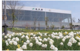
花と旭川駅を撮影できる場所として人気（5月上旬のスイセン）。

JR 旭川駅南口に直結。通勤・通学、旅の途中に気軽に立ち寄れるエリア。テーマの異なる3つの花壇を楽しむことができ、駅に近い場所には華やかな園芸品種を主体とした「川のボーダー花壇」、忠別川に近い場所には北海道の自然を感じられる自生種を主体とした「疎林テラス」「水路メドウ」という花壇を鑑賞できる。