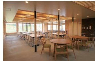
ガーデンセンターは休憩所として利用でき、貸切る事も可能

ビジターセンターの機能を持つガーデンセンターと、専用駐車場があるガーデンの中心エリア。旭川駅からは徒歩7分ほど。様々なテーマを持つ花壇が作られ、実用的なハーブ・野菜を取り入れたエリアや宿根草を多彩に植栽した花壇、一年草を植え込み華やかにデザインされた花壇などが充実している。ガーデンに足を運んだ記念撮影が出来るトピアリー（立体花壇）なども話題を集めている。