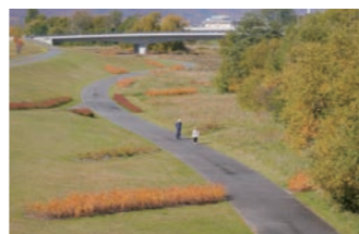
紅葉の頃のグラスガーデン（9月下旬～10月）

南6条通り沿いに花木類を主体に植えた「歩北穂の路」、忠別川の対岸に自生種を主体に植えこんだ遊歩道「グラスガーデン」が整備されている。川と街と人をつなぎとめるコンセプトを元につくられ、広域なエリアに渡ってガーデンが広がる。花木の見頃は主に7月後半から8月、グラスガーデンは花の時期だけでなく、秋の草紅葉の頃も散策におすすめ。