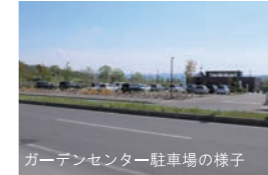
ガーデンセンター駐車場の様子