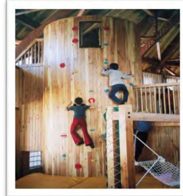
ウォールクライミング