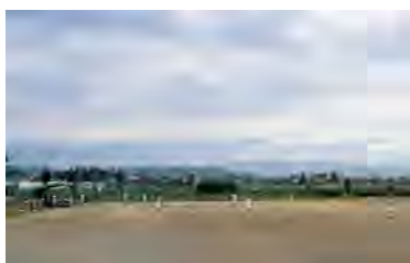
運動広場(多目的グラウンド)