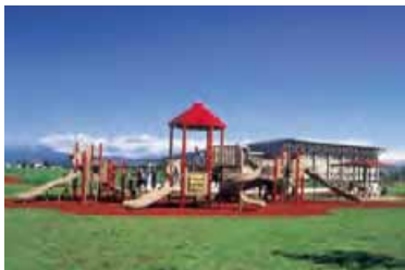
コンビネーション遊具