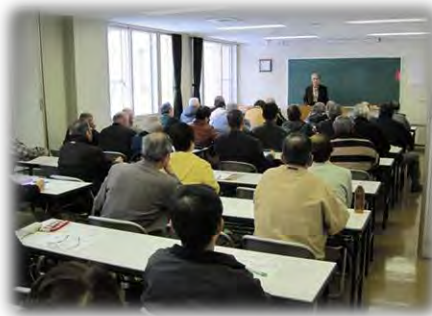
果樹の剪定と栽培管理