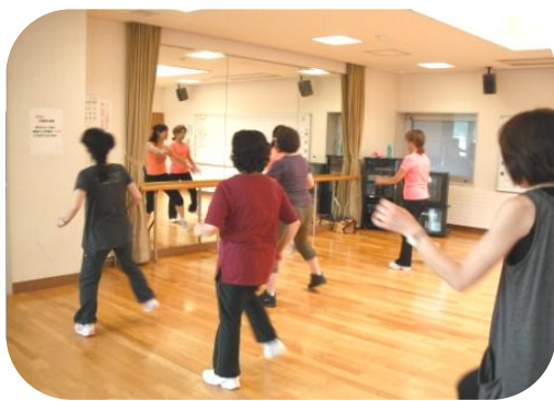
エアロビクス教室