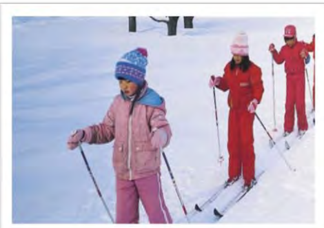
クロスカントリーコース