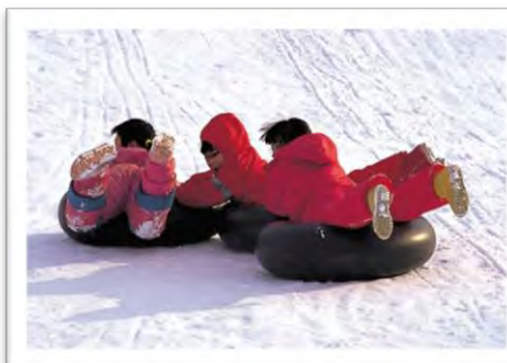
チューブ滑りもあります