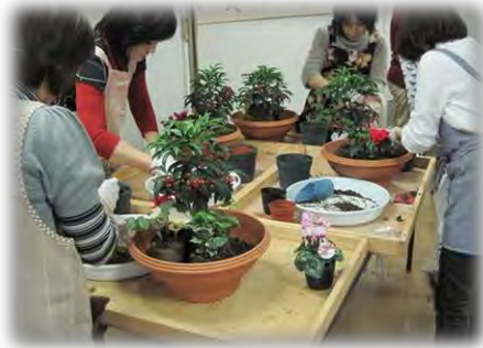
クリスマスからお正月の寄せ植え