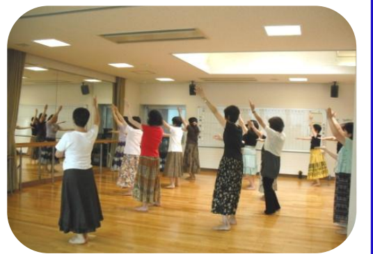
リフレッシュフラダンス教室