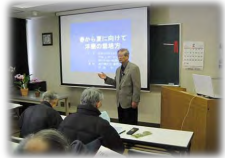
洋ラン！春から夏の育て方