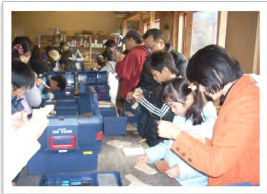
小物入れ作り教室