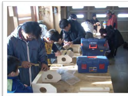
マガジンラック作り教室