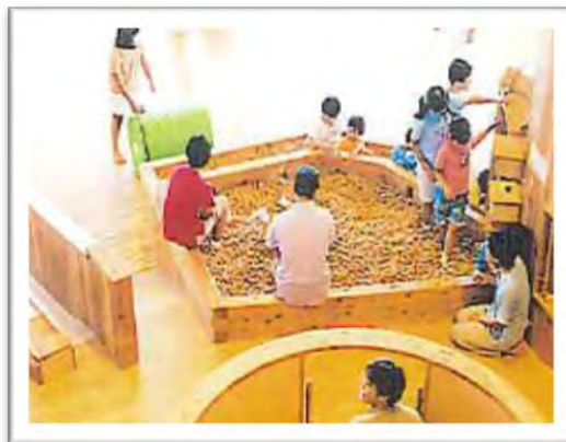
木のボールプール