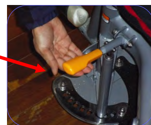
足パッドの位置の調整