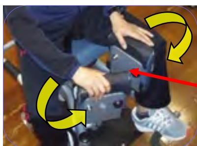
足パッドの向きの調整

内転筋のトレーニングは、 パッドを外側に向けて、足は外側。 外転筋のトレーニングは、 パッドを内側に向けて、足は内側。