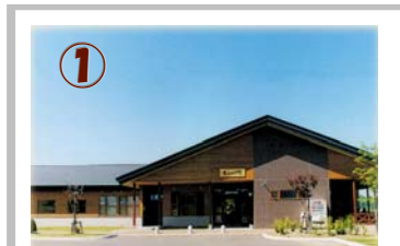
体験学習館でキャンプ場使用の申し込み