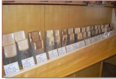
原木の展示コーナー 「ナナカマド」「イタヤカエデ」など18種類の原木を詳しく学べます。

カムイの杜公園内には、「森のふしぎ館（体験学習館）」という建物があるのをご存じですか？そこには、ここで紹介する展示物や楽しい木製遊具があるんですよ。木製の遊具で遊んで、木のぬくもりを感じて、いろんな自然について学んでみましょう！