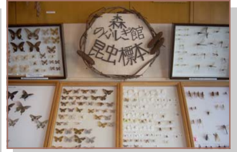
森のふしぎ館昆虫標本 昆虫の標本を展示し、カムイの杜公園や奥地で採取されたトンボ、蝶を観察し学習できます。