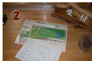
キャンプ場使用申込書記入場内の説明案内