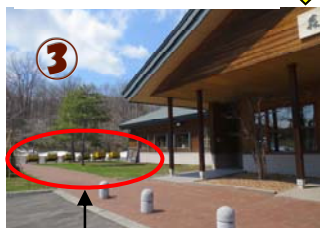
荷物はキャンプ場までリヤカーを使用体験学習館横に6台設置