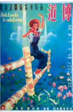
▲北海道開発大博覧会ホスター(画:栗谷健一)