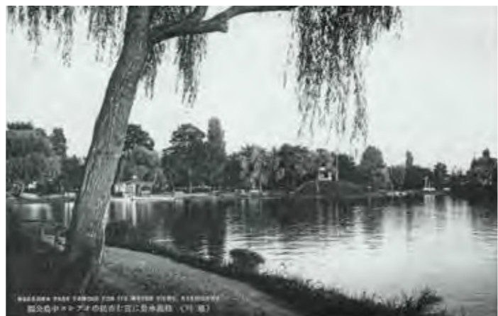
▲旭川絵葉書の1枚。左下の文字は「緑陰水景に富む市民のオアシス中島公園」。公園名称が定まっていなかったことがわかる。昭和10年頃撮影

大正5(1916)年5月1日、道路、池堀、築山、地ならし、植樹など大体の基礎工事を終え、ここに常盤公園が誕生します。さらに大正6(1917)年には園内の橋を架設、四阿建築、ベンチの設置、また大正7(1918)年、茶店の2カ所の設置、2名の池水面遊船業が開始され、徐々に公園としての姿を整えながら、人々の和楽の場所として栄えていくのです。