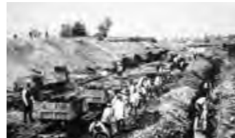
▲牛朱別川切替工事の作業風景