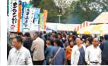
▲食べマルシェ開催