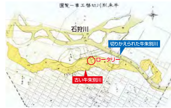
▲牛朱別川切替工事の概要図。当時の地図を見ると常盤公園が「島」であったことがよくわかる

翌9(1920)年に復旧工事が開始され、大正13(1924)年には上川神社頓宮が千鳥ヶ島に竣工しますが、発展を続ける旭川の都市計画上、繰り返される牛朱別川の氾濫への根本的な対策が急務となっていました。