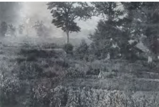
▲「旭川町対第七師団協定書」によって公園の造成が決まった旭川町中島一帯は荒涼とした低湿地帯だった。明治40年代の撮影