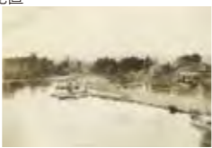
▲大正10年頃の常盤公園。右手奥に写る建物が料亭「大中」