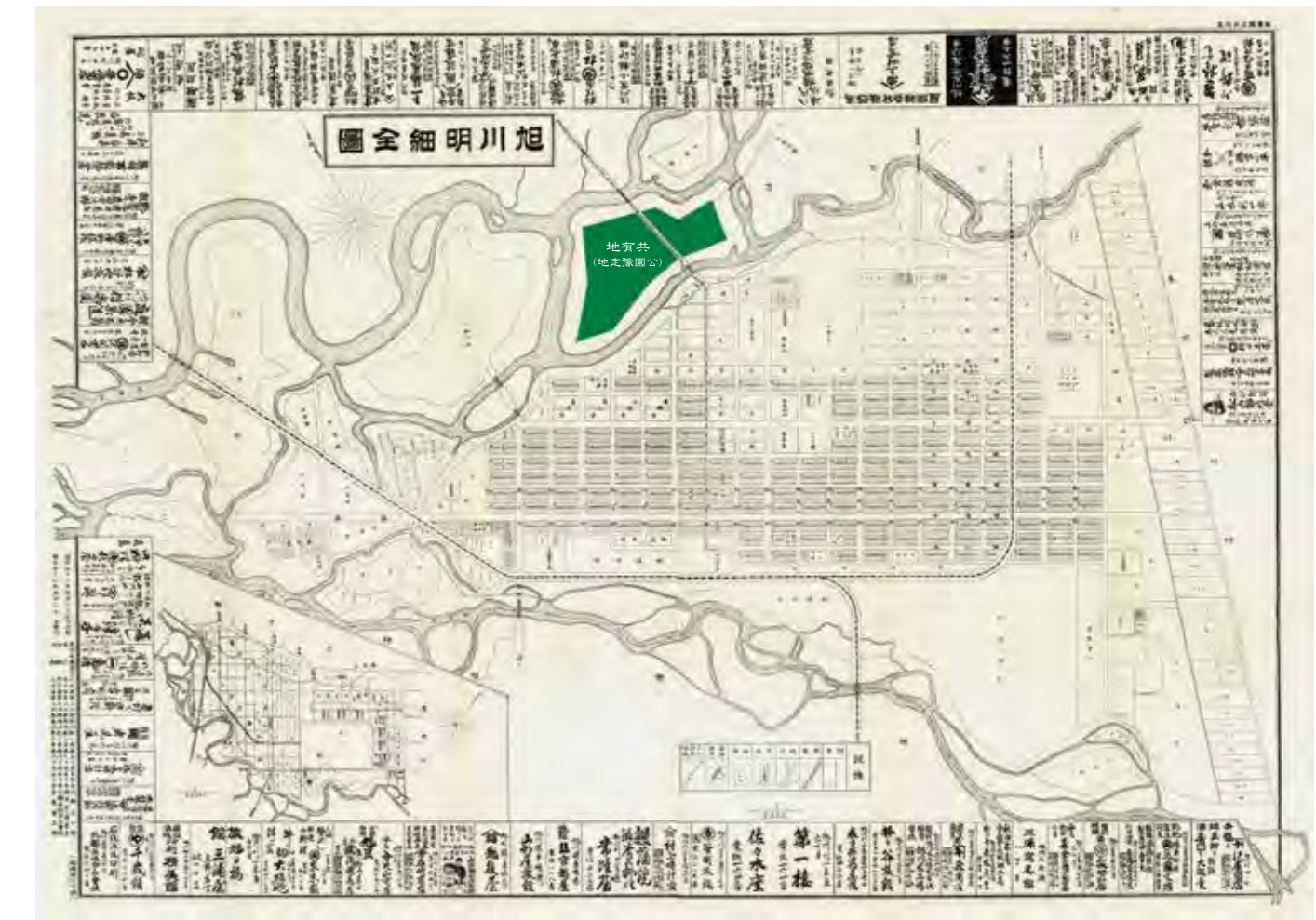
【明治43年の旭川市街地図】 石狩川と牛朱別川に挟まれた中州に「公園予定地」の文字が見える

表紙写真 昭和35年頃の常磐公園周辺 題 字 渡辺錠太郎 第10代 第七師団長(在任/大正15年～昭和4年)