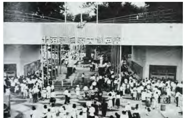
▲40日間で51万人を超える人が訪れた「北海道開発大博覧会」