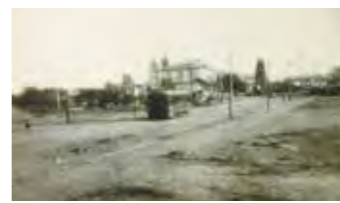
▲牛朱別川埋立直後のロータリー付近