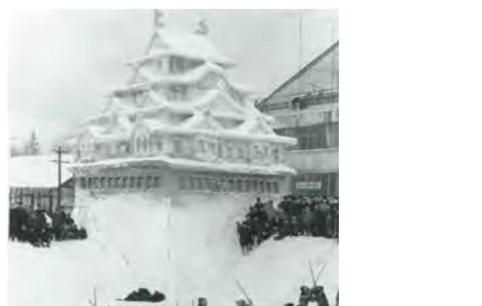
▲第1回旭川冬まつり。名古屋城を象った大雪像前で剣道の寒稽古が行われている。昭和61(1986)年に隣接するリベライン旭川パークに移されるまで、常盤公園で開催された

牛朱別川の改修を経て、公園遊具、照明灯が設備され、植物園2施設、花月園などの料理店4店舗、貸ボートが5業者、テニスコート、グラウンドでの野球、自転車競走、冬季には千鳥ヶ池のスケートリンク、さらに博覧会・壮行会・お祭りなどの会場、またデーツポットとして、常盤公園は季節を通して市民に親しまれていきます。