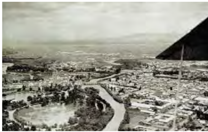
▲牛朱別川河川切替前の常盤公園空撮。昭和4年撮影

上川盆地の大小河川が集中して流れ込む川のまち・旭川にとって、豪雨時の水害対策は緊急課題でした。とりわけ牛朱別川は上流部の流れこそ安定しているものの、9条通18丁目に架かる宗谷線鉄橋を境に蛇行しながら屈曲、石狩川からの派流も流れ込み、昭和5(1930)年に切替工事が完了し、翌6年には切替が完了し、同年、旧流路の埋立工事が開始され、さらに埋立工事に伴う公園改造がなされ、翌7(1932)年には埋立工事も完成します。常盤公園と並ぶ旭川のシンボル「旭橋」新設もこの工事の一連でした。