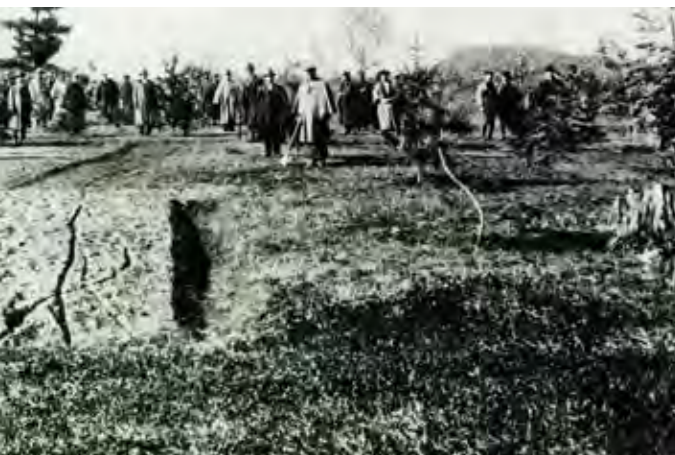
▲造成中の常盤公園を視察する旭川町議会メンバーら。まず池と築山が作られ、その後、植樹が行われた。写真の背後にはすでに築山が見えている

発足間もない明治政府が文明開化の指針を掲げ「明治6年太政官布告第16号」の政令をもって、公園の必要性と設置を呼びかけたのが明治6(1873)年。それから17年後の明治23(1890)年に村が置かれた旭川は、屯田兵の配備、鉄道上川線の旭川延伸、第七師団移駐などにより発展の一途をたどり、明治34(1901)年には村から町に昇格します。その際に設置された町村制実施準備委員会で公園造成が決議されます。当初の公園予定地は4・5条通18丁目先一帯の陸軍用地「司令部台」(現、願成寺・妙法寺・朝日小学校一帯)。陸軍当局と交渉に当たったものの条件が折り合わず、1条通20丁目以南のウシシベツ共有地に予定地を変更しますが、ここでも着手には至らないまま、日露戦争が始まります。